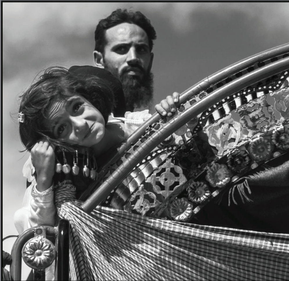
Kaghan Tal/ Kaghan Valley Khyber Pakhtunkhwa