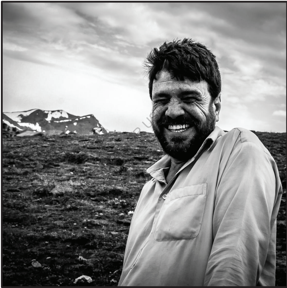
Babusar Pass, Khyber Pakhtunkhwa